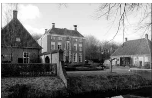
• Havezate de Havixhorst.

kade, vergezeld van mooie Duitse wijnen en een heerlijke 2007 Meursault Vincent Girardin. Jhr. Bib en zijn vrouw woonden ooit in een bijgebouw van Kasteel Maurick. Alweer vele jaren zijn zij de gelukkige bezitters van de ruim 200 hectare grote